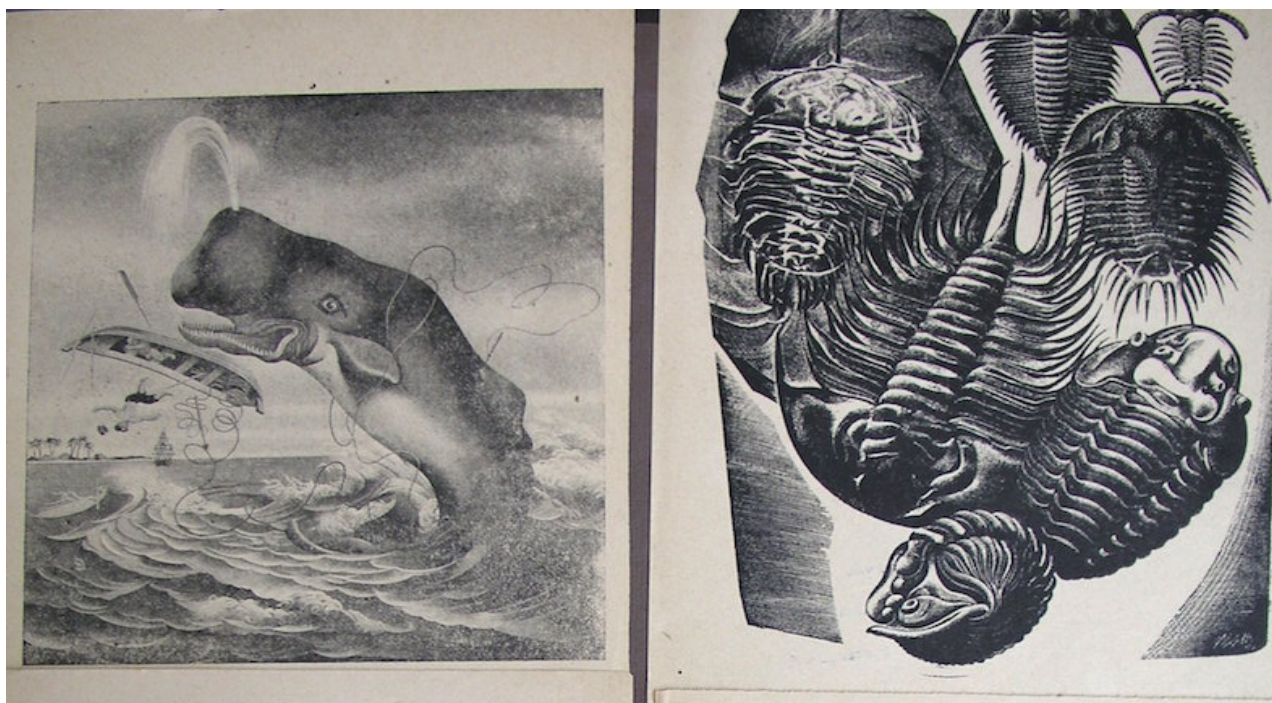
Dos pruebas de ilustraciones del "Libro del Mar"