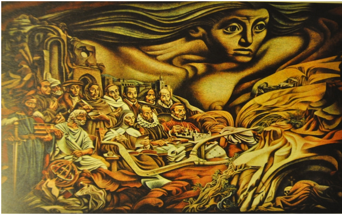
Un aspecto del mural.

Los tres últimos citados eran pintores muralistas mejicanos que realizaron sus propios trabajos en el edificio, al igual que Renau. Su mural se ha titulado de varias maneras: España hacia América , El nacimiento de la Hispanidad o Mural de la conformación hispánica .