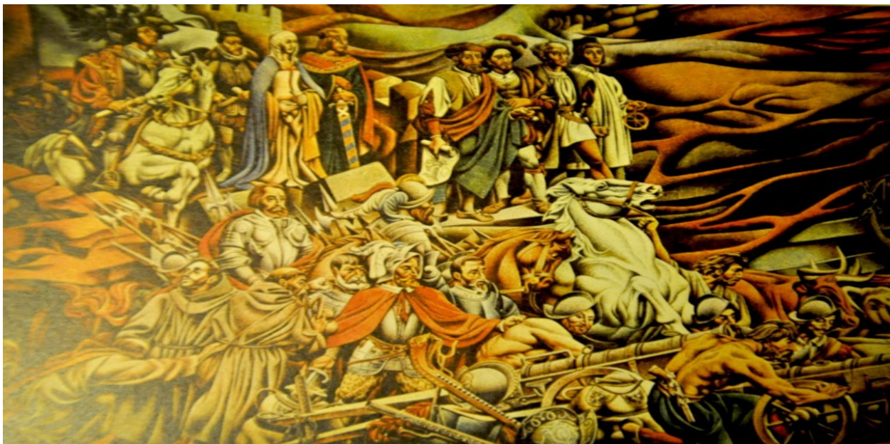
Otro panel del mural.

Algunos se han preguntado cómo podía sentirse Renau orgulloso de este mural, España hacia América, siendo un marxista ortodoxo. El argumento de que es una obra coherente con el realismo socialista puede resultar aceptable. Otro, más incómodo para los progresistas fundamentalistas, es que Renau se creía lo que estaba haciendo, aunque no supo explicarlo.