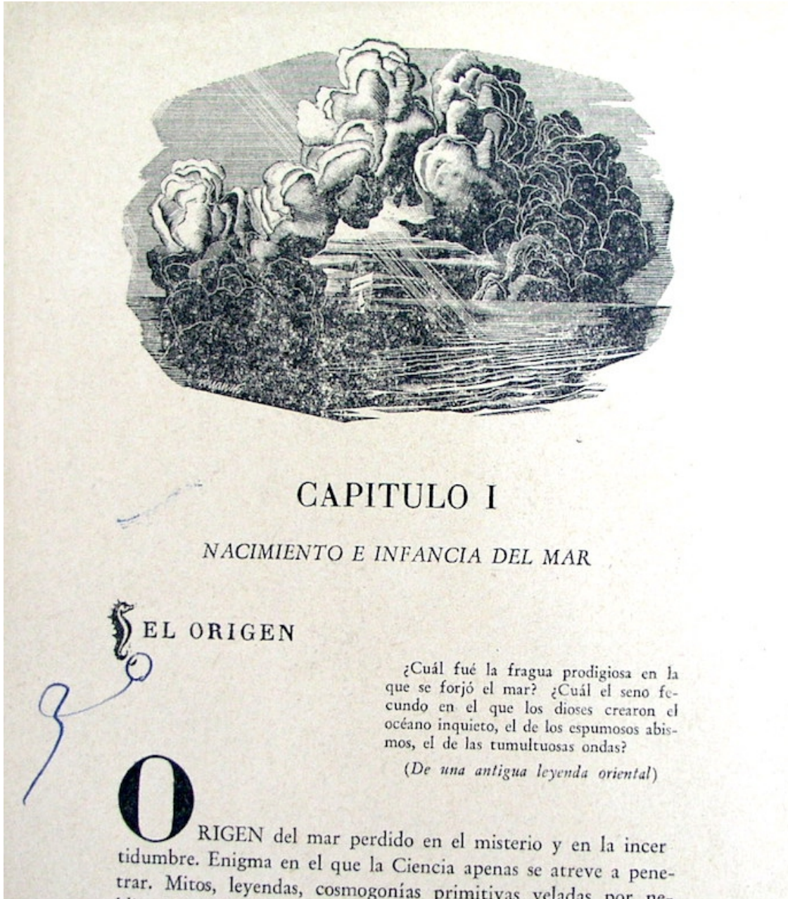
Primer capítulo del "Libro del Mar"

resulta clave para entender los pasos hacia delante que dio Renau en sus fórmulas de fotomontaje político, al que dedicaremos el próximo capítulo. Porque, aunque coleccionaba revistas Life y otros mensuarios y semanarios ilustrados “del imperialismo”, es posible que ni se molestara en leerlos, o que lo hiciera a través del prisma del dogma marxista. Teresa, la mejor dotada de todos los hermanos para la pintura y el dibujo, de niña tuvo la ilusión de trabajar para Walt Disney, cuyas películas le encantaban. Cuenta lo siguiente.