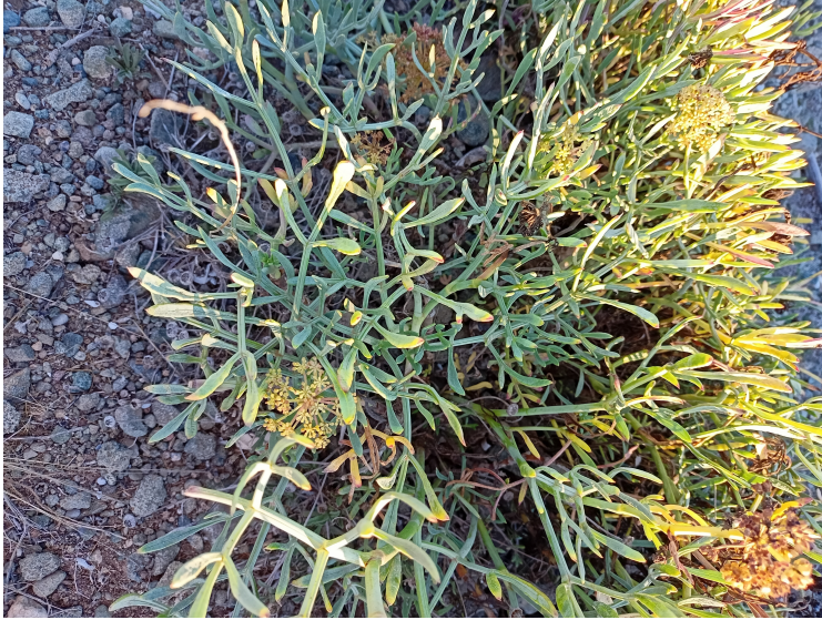
Hinojo marino ( Crithmum maritimum )