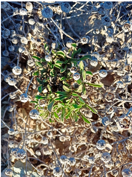
Margarita maritima ( Pallenis maritima )