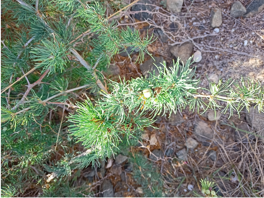
Esparraguera ( Asparagus albus )