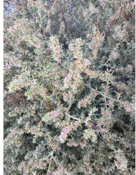
Barrilla borde ( Salsola kali )