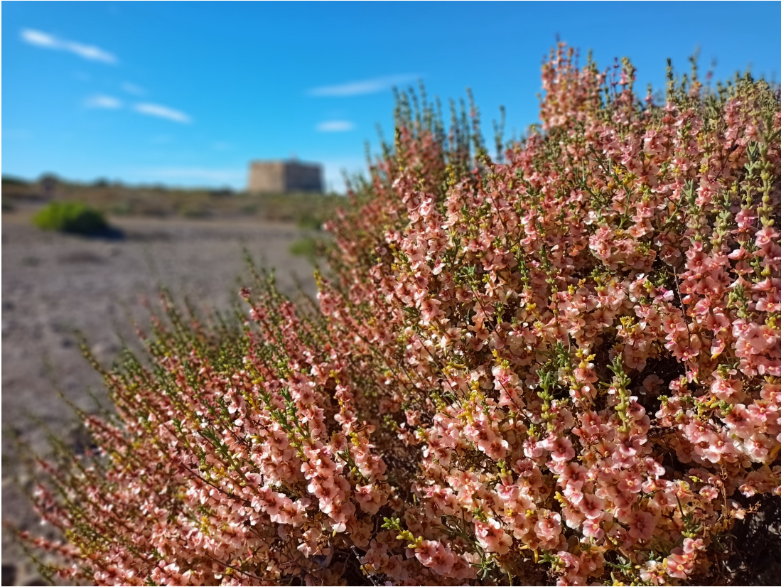
Salao borde ( Salsola oppositifolia )