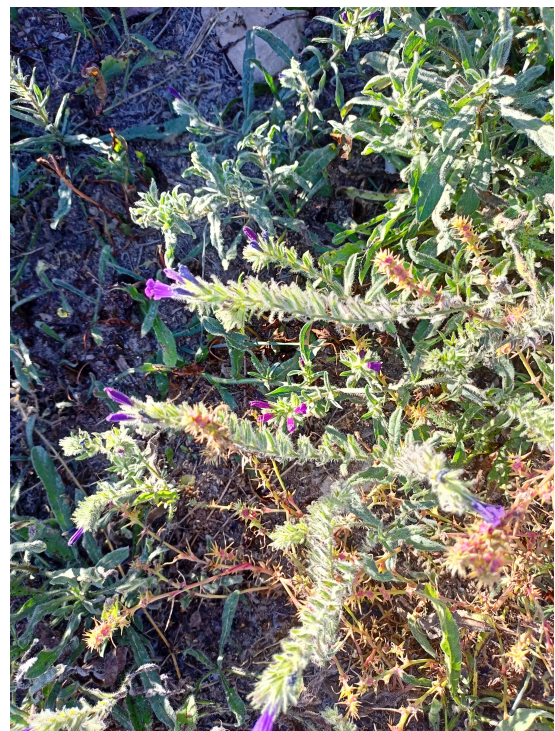
Viborera maritima ( Echium sabulicola )