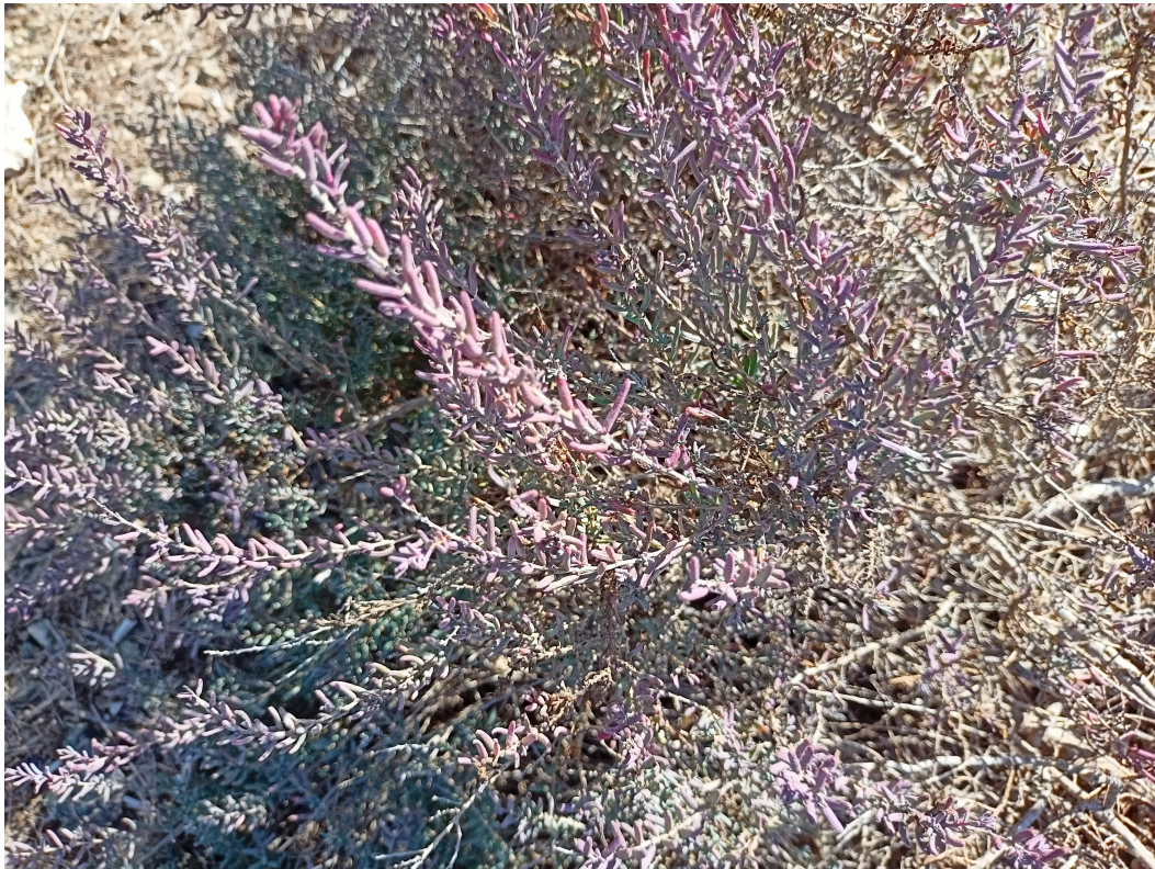
Sosa ( Suaeda vera )